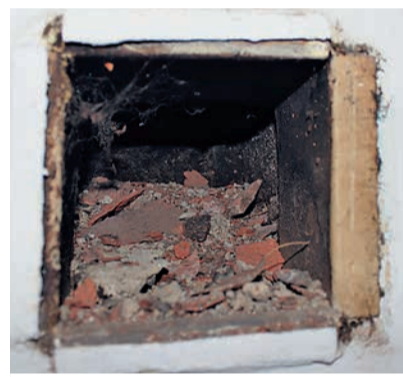
Труба дымохода, заваленная кирпичной кладкой

«При отсутствии тяги продукты сгорания не уходят, а накапливаются в помещении и негативно влияют на здоровье. Даже небольшая концентрация угарного газа может привести к печальным последствиям.